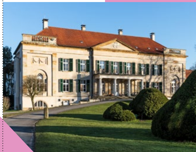
Abb.: Foto Marburg A. Lechtape

Herrenhaus Harkotten. Harkotten 2, 48336 Sassenberg